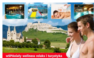
WSPAniały wellness relaks i turystyka